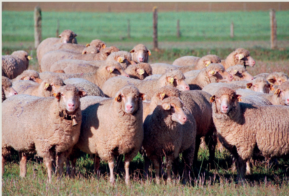
Figura 3 – Ovinos da raça Merina Branca

veis, para identificar variantes genéticas que estão associadas à resistência e que poderão ser utilizadas em futuros programas de seleção genômica, aplicados numa ótica de melhoramento animal de precisão. Dado que múltiplos genes poderão estar envolvidos no mecanismo de resistência, os estudos de associação genética requerem a análise de um grande número de marcadores genéticos e a avaliação de várias características fenotípicas. Contudo, é aqui que muitos dos estudos prévios apresentam falhas, ao considerarem apenas um número reduzido de marcadores genéticos e a sua possível associação com características de resistência. Para ultrapassar estas limitações, propomos uma metodologia inovadora, baseada na tecnologia Illumina OvineHD BeadChip recentemente disponível, que permite analisar a variação genética em mais de 600 000 marcadores SNP (variações na sequência de DNA que afetam uma única base, do inglês Single Nucleotide Polymorphism ) no genoma ovino. A associação entre o fenótipo e genótipo será determinada através de estudos de associação do genoma inteiro, conhecidos como estudos GWAS (do inglês Genome-Wide Association Studies ) e utilizará um amplo conjunto de marcadores fenotípicos, nomeadamente a FEC, índices de anemia medidos com a escala de cor FAMA-CHA®, peso corporal e parâmetros hematológicos e bioquímicos (hemograma, proteínas totais, albumina, AST, ALT).