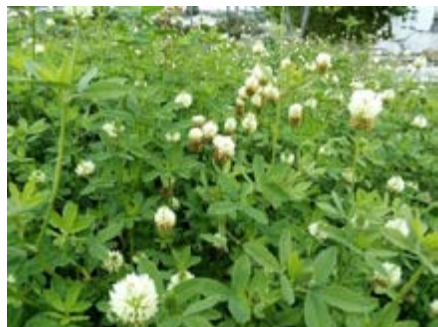
Bersim ( Trifolium alexandrinum )

Grande capacidade de rebrote; exigente em água; pouco resistente ao encharcamento; Tolera solos salinos.