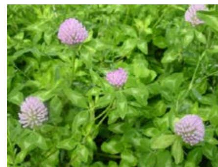
Trevo-violeta ( Trifolium pratense )

Bem adaptada a territórios de clima continental, com invernos frios e verões quentes e secos; suporta alguma salinidade; é sensível à acidez e ao encharcamento do solo