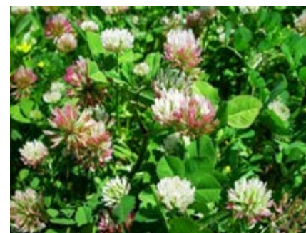
Trevo-balansa ( Trifolium michelianum )

Porte semi-ereto a ereto; adapta-se a solos de variadas texturas e de pH; tolerante à salinidade e ao encharcamento.