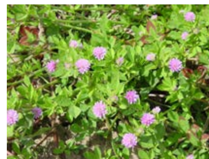
Trevo-da-Pérsia-das-flores-grandes ( Trifolium suaveolens )

Porte semi-ereto a ereto; adapta-se a solos de variadas texturas e de pH; tolerante à salinidade e ao encharcamento.