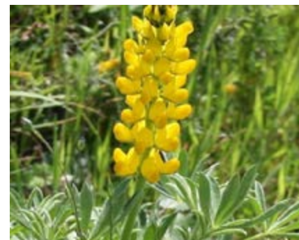
Tremocilha ( Lupinus luteus )

Adapta-se a terrenos pobres, de reação ácida; muito rústica, excelente antecessora de culturas mais exigentes; adapta-se a terrenos pobres, de reação ácida