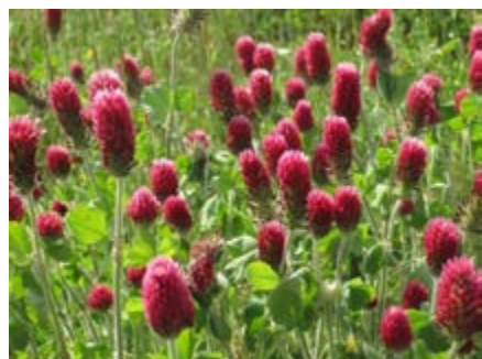
Trevo-encarnado ( Trifolium incarnatum )

Anual de crescimento ereto; adaptado a diversos tipos de solos e utilizações. Muito persistente.