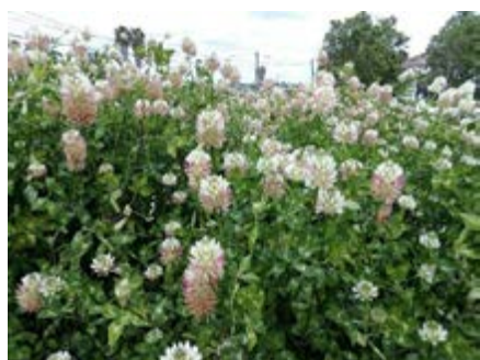
Trevo-vesiculoso ( Trifolium vesiculosum )

Grande capacidade de rebrote; exigente em água; pouco resistente ao encharcamento; Tolera solos salinos.