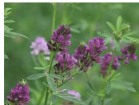
Luzerna ( Medicago sativa )

Bem adaptada a territórios de clima continental, com invernos frios e verões quentes e secos; suporta alguma salinidade; é sensível à acidez e ao encharcamento do solo