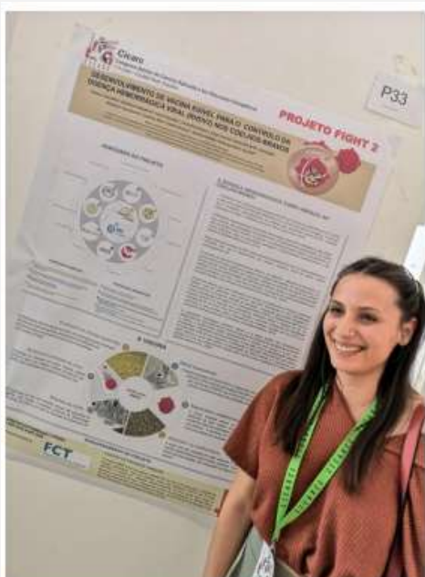
CICARC, Ciudad Real, 4 de julho de 2019.

O painel, intitulou-se “Quadro estratégico FIGHT-2 – Desenvolvimento de uma vacina edível para o controlo do vírus da doença hemorrágica viral de tipo 2 (RHDV2) no coelho-bravo”.